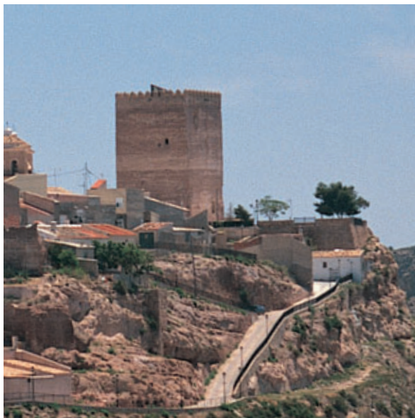
El castillo de Aledo. Esta fortaleza fue reconquistada por los cristianos (1086) y sirvió de lanzadera de expediciones.